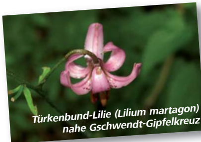
Türkenbund-Lilie (Lilium martagon) nahe Gschwendt-Gipfelkreuz

E-Mail: service@verbundlinie.at www.verbundlinie.at BusBahnBim-App: für alle Smartphones in den jeweiligen Stores (Google, Apple, HUAWEI)