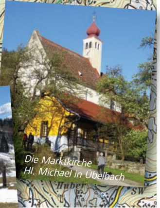
Die Marktkirche Hl. Michael in Übelbach

© 2020 beim Herausgeber Verkehrsverbund Steiermark GmbH , 8010 Graz Recherchen, Texte, Karteninhalt, Fotos, GPS-Streckenprofil (downloadbar): Dieter Fleck, Graz; Druck: Niegelhell GmbH, 8435 Leitring Titelbild: Der Feger-Hof auf dem Weg von Neuhof zur Bockstaller Hütte Alle Angaben wurden sorgfältig zusammengestellt sowie die gesamte Route vom Autor persönlich erkundet. Eine Gewähr für die Richtigkeit der Angaben kann nicht übernommen werden. Maßgebend sind die realen Gegebenheiten.