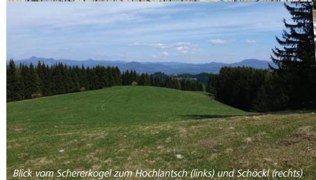
Blick vom Schererkogel zum Hochlantsch (links) und Schöckl (rechts)